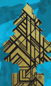
GOLD Blister de 1. [COD. 02102] Caja 6 x 24 un.