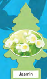
JASMIN Blister de 1. [COD. 10433] Caja 6 x 24 un.