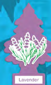
LAVENDER Blister de 1. [COD. 10435] Caja 6 x 24 un.