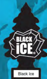
BLACK ICE Blister de 1. [COD. 10155] Caja 6 x 24 un.