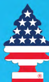
VANILLA PRIDE Blister de 1. [COD. 10945] Caja 6 x 24 un.