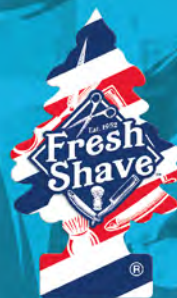
FRESH SHAVE Blister de 1. [COD. 70682] Caja 6 x 24 un.