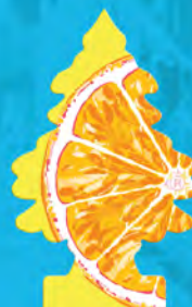
SLICED Blister de 1. [COD. 10155] Caja 6 x 24 un.