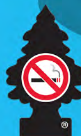
NO SMOKING Blister de 1. [COD. 17037] Caja 6 x 24 un.