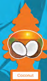
COCONUT Blister de 1. [COD. 10317] Caja 6 x 24 un.