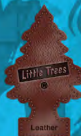
LEATHER Blister de 1. [COD. 10290] Caja 6 x 24 un.