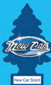
NEW CAR SCENT Blister de 1. [COD. 10189] Caja 6 x 24 un.