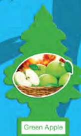
GREEN APPLE Blister de 1. [COD. 10316] Caja 6 x 24 un.