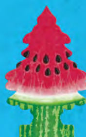
WATER MELON Blister de 1. [COD. 11556] Caja 6 x 24 un.