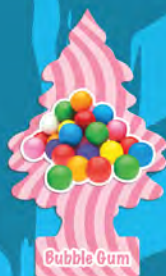
BUBBLE GUM Blister de 1. [COD. 10348] Caja 6 x 24 un.