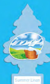
SUMMER LINEN Blister de 1. [COD. 10574] Caja 6 x 24 un.