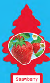
STRAWBERRY Blister de 1. [COD. 10312] Caja 6 x 24 un.