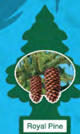
ROYAL PINE Blister de 1. [COD. 10101] Caja 6 x 24 un.